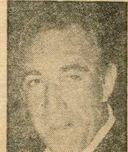
• Anthony Quinn, actor que trabaja en la película "El Último Guerrero".

• CERVANTES: "La Cumbre y el Abismo", excelente cinta sobre el mundo de los ídolos de la canción. Además, "Fiebre de Velocidad". Rotativo desde las 14.30 horas.