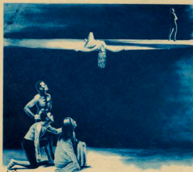
FESTIVAL LATINOAMERICANO DE TEATRO UNIVERSITARIO MANIZALES 1970