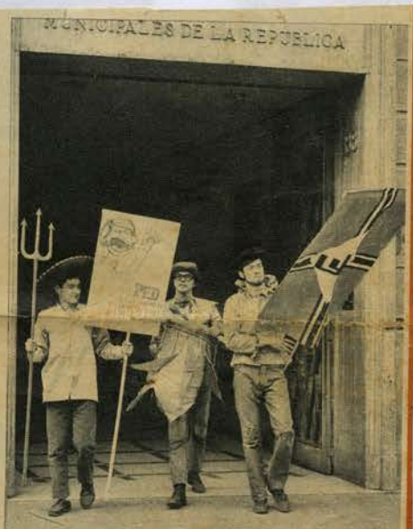
CARTELES VIOLENTOS.— En ambas reproducciones podemos apreciar la violencia de los lemas del partido político que propician. Por supuesto se trata solamente de una jigarreta... Son las consignas del P.E.D. (Partido Ereccionista Dinámico), agrupación que aparece en la obra "El Pequeño Malcom y su Lucha Contra los Eunuocos", pieza de David Halliwell, que el TEKNOS presenta diariamente en el teatro Bulnes.